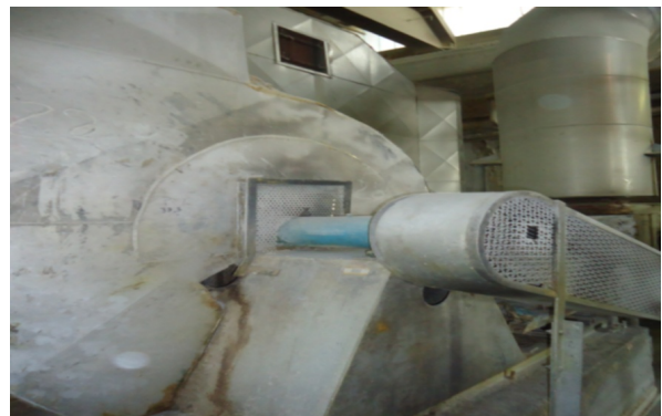
↑ Verbrennungsluftanlage in einer Papierfabrik